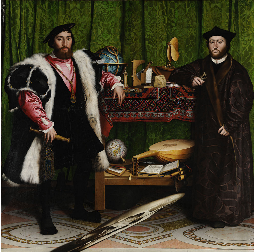
Hans Holbein, The Ambassadors , 1533. हैंस होल्बीन, द एंबेसडर, 1533।

You are allowed to use phone or computer-based translation for this assignment. If you do, please send the results to: ddrapak@gnspe.ca .