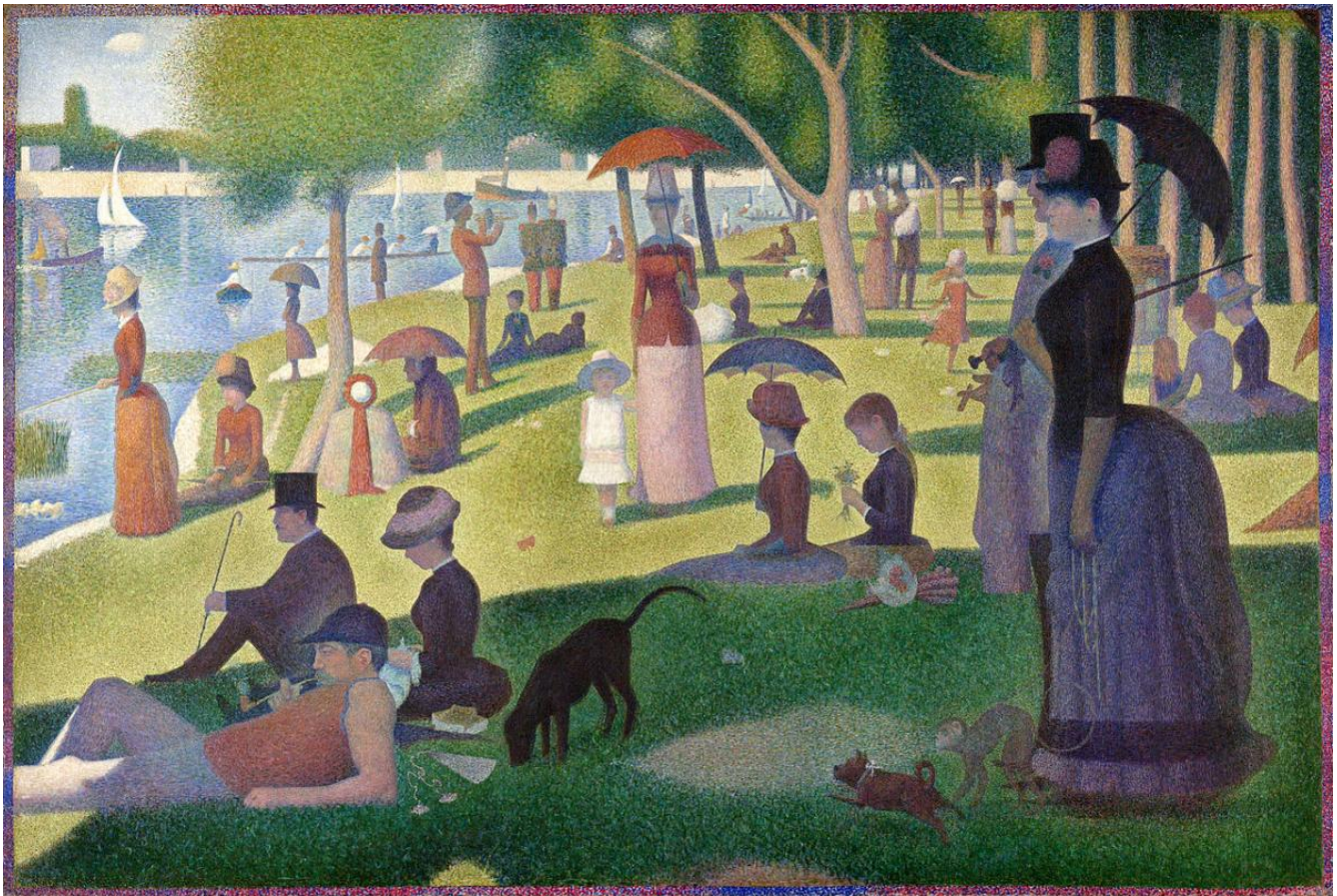
Georges-Pierre Seurat, A Sunday Afternoon on the Island of La Grande Jatte , 1884–1886 जॉर्जेस-पियरे सेराट, ला ग्रांडे जट्टे के द्वीप पर रविवार की दोपहर, 1884-1886