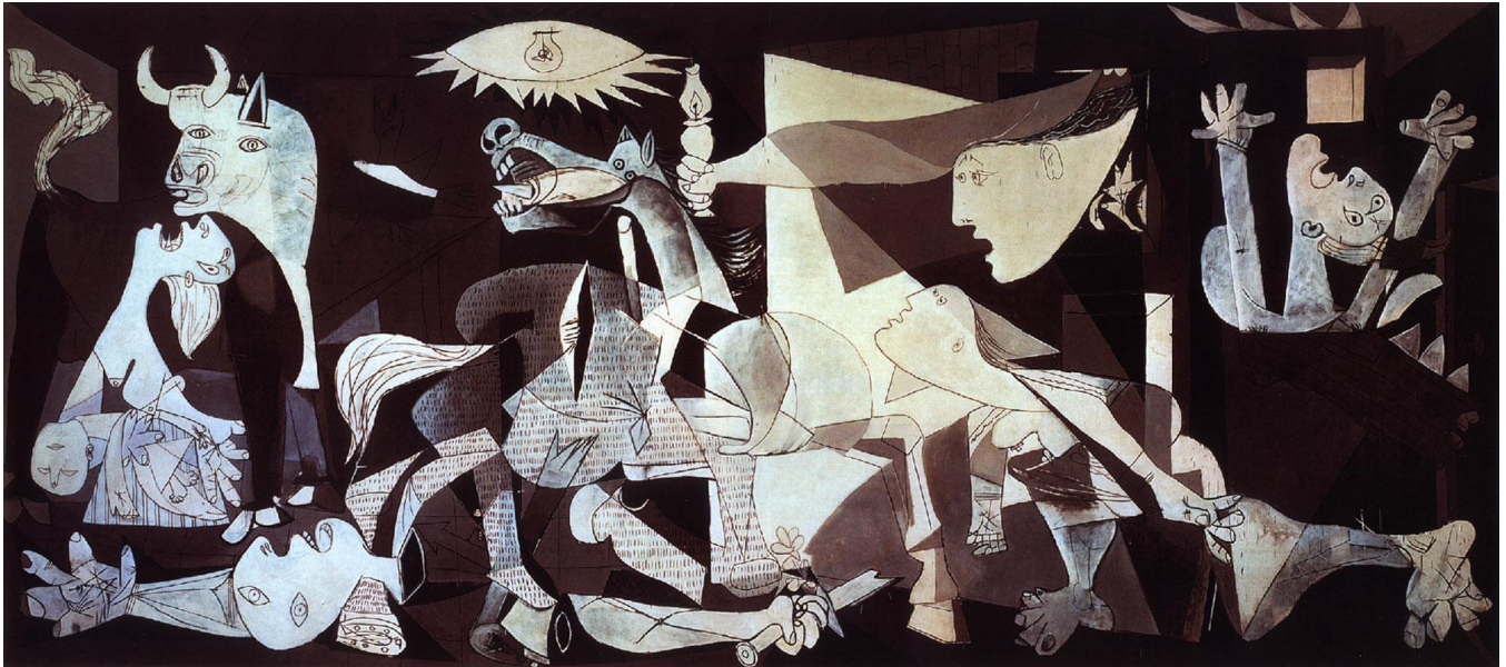
Pablo Picasso, Guernica , 1937